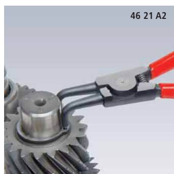
46 21 A2