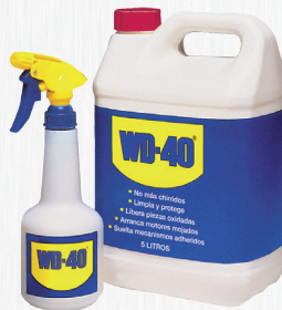
Garrafa 5 litros

El formato Doble Acción permite una aplicación amplia o precisa del producto, garantizando que nunca se perderá la cánula