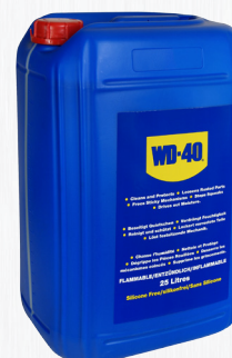
Bidón 25 litros

Garrafa para uso industrial que viene acompañada de un pulverizador para una más sencilla aplicación